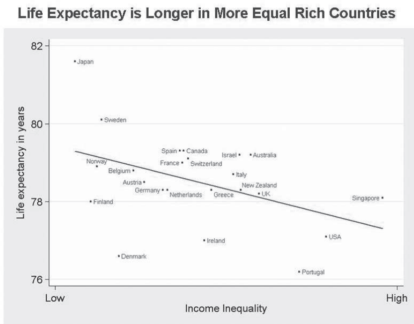
Figuur 2 - Inkomensverdeling en levensverwachting.